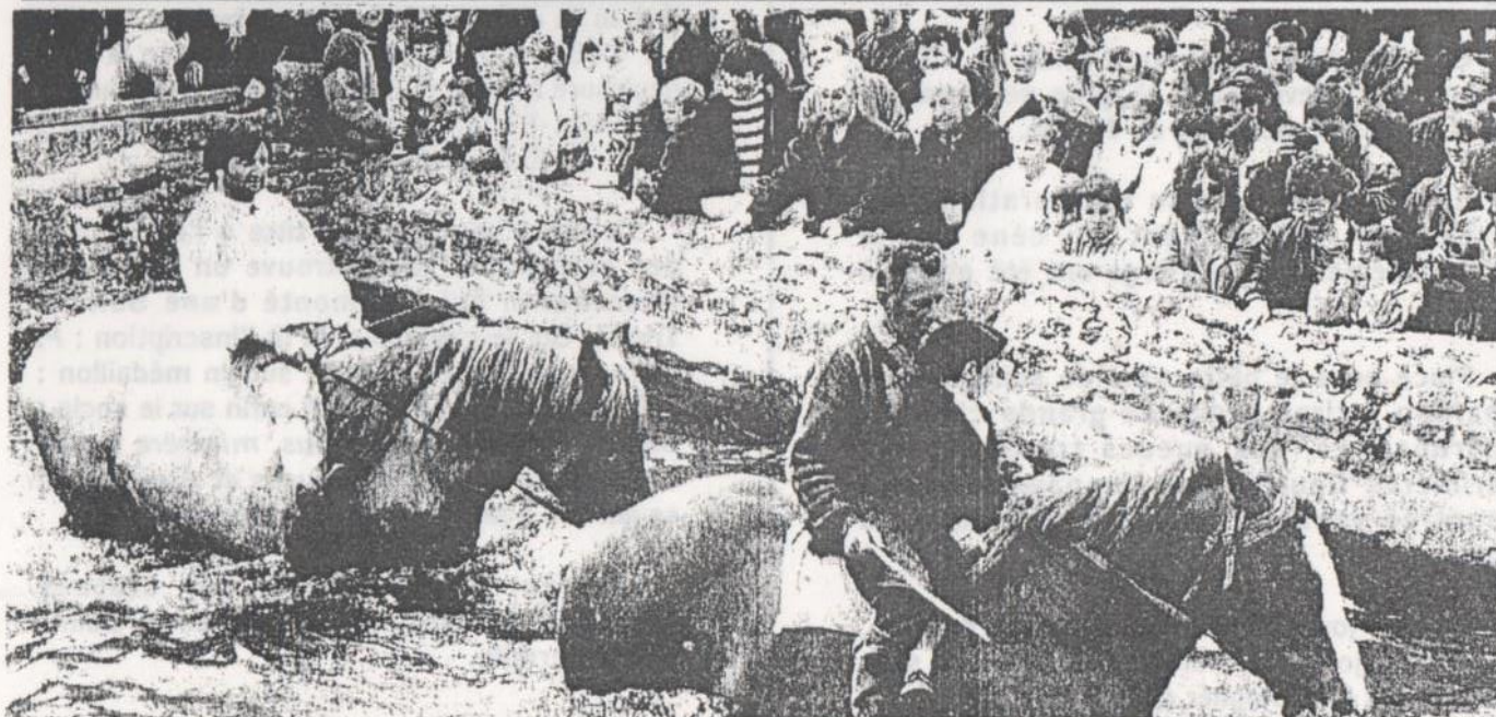
Pardon de Restudo, le dernier ou avant dernier dimanche de Juin